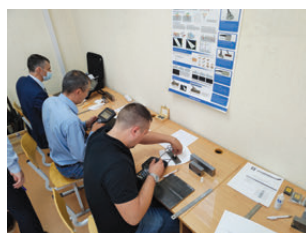
Проведение практического экзамена по ультразвуковому контролю