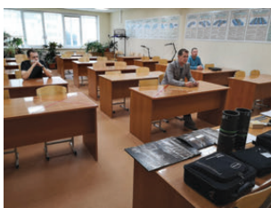
Проведение экзамена по визуально-измерительному методу НК

Основной задачей Тюменского областного регионального отделения РОНКТД является профессиональное обучение методам неразрушающего контроля.