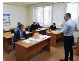
Проведение конкурса по ультразвуковому контролю