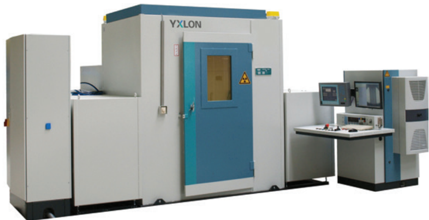
Система рентгеновского контроля колес Y.MU231

Новый графический интерфейс пользователя интуитивно