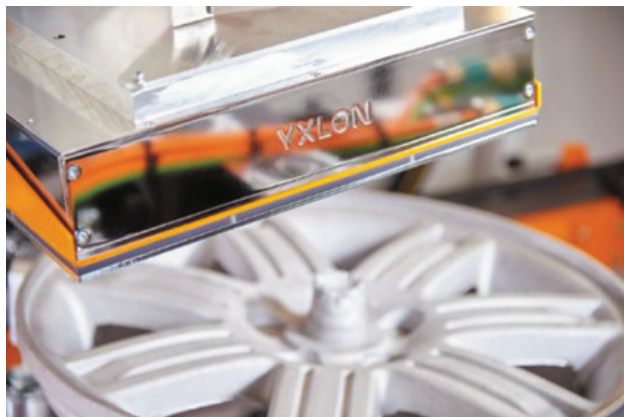
Плоскопанельный детектор YXLON

Современные колеса в основном льются из алюминиевых сплавов, которые при небольшом весе все же обеспечивают необходимую прочность. Поскольку с этими деталями связана безопасность автомобилей, контроль качества является обязательным. Рентгеновская технология зарекомендовала себя как лучший метод контроля в этой области, так как она надежно распознает внутренние структуры с размерами до десятых долей миллиметра, такие как посторонние включения, газовые пузыри и пористость, которые впоследствии могут испортить внешний вид готового колеса или даже привести к его разрушению. Дефектные колеса затем могут быть отбракованы как незавершенные отливки и расплавлен-