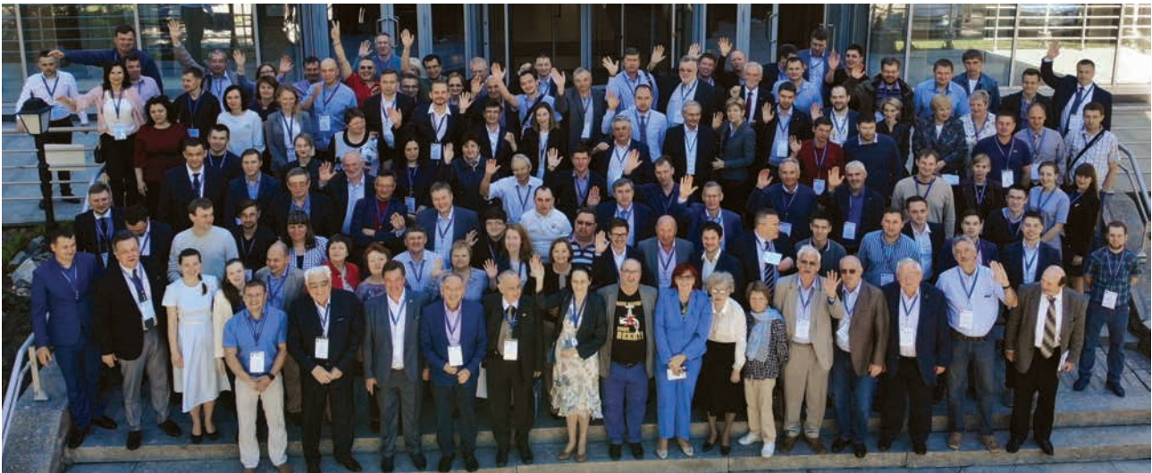
Коллективное фото. До встречи на следующей «УЗДМ»!

тербургского научно-практического семинара по НК, более известного как Клуб профессионалов НК – «Гурвич-клуб» (информация о заседаниях клуба неоднократно публиковалась в нашем журнале).