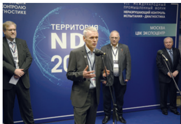
Торжественное открытие форума