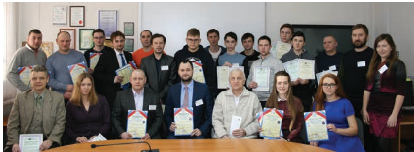
Участники отборочного тура. Томск