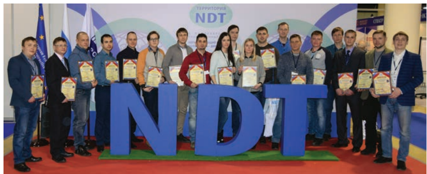
Призеры конкурса на V Международном промышленном форуме «Территория NDT. Неразрушающий контроль. Испытания. Диагностика»