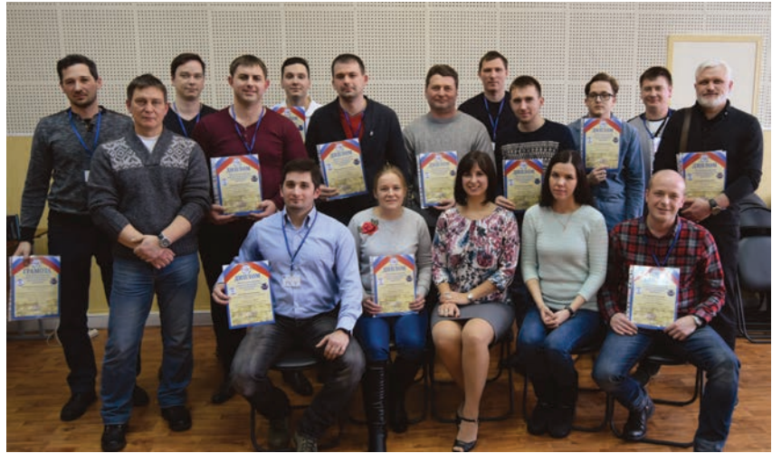
Победители отборочного тура. Москва

В первом туре конкурса, который прошел в регионах России с 22 января по 9 февраля 2018 г., приняли участие около 220 специалистов из 73 организаций,