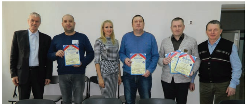
Победители отборочного тура. Томск