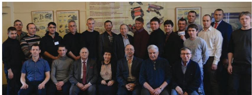
Участники отборочного тура. Иркутск