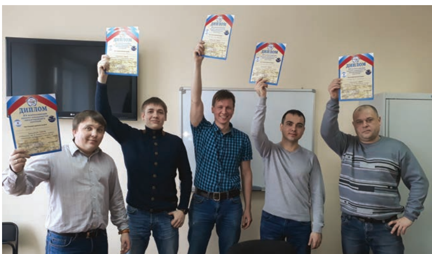
Победители отборочного тура. Уфа