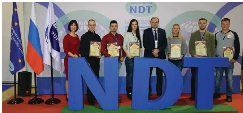
Победители конкурса на V Международном промышленном форуме «Территория NDT. Неразрушающий контроль. Испытания. Диагностика»