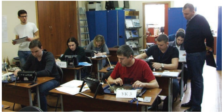
Финальный тур конкурса теоретическая и практическая части