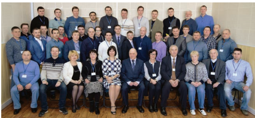
Жюри и участники финального тура конкурса