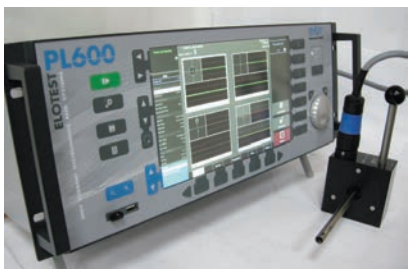
Рис. 2. Вихретоковый дефектоскоп ELOTES PL600

для работы с вихретоковым дефектоскопом ELOTES PL600 (рис. 2).