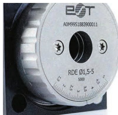
Рис. 3. Блок вращающихся преобразователей с регулируемым диаметром проходного отверстия