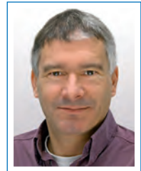
Martin Spies Fraunhofer Institute for Nondestructive Testing, Saarbrücken