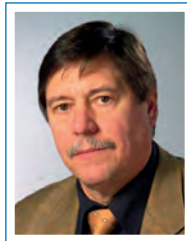
Anton Erhard Federal Institute for Materials Research and Testing, Berlin